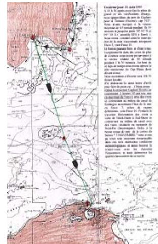
Redoutable Canal de Sardaigne, traversée Sardaigne Tunisie, en moins de 3H)

Article Mag F10 en GRECE Traversée du Canal de Corinthe